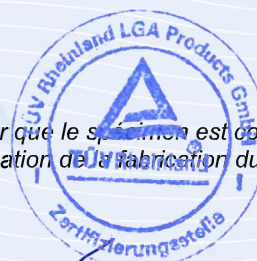
A. Chen Certificateur

La vérification de la conformité concerne le produit susmentionné. Elle a pour but de vérifier que le système est conforme aux exigences d'évaluation mentionnées ci-dessus. Cette vérification n'implique pas l'évaluation de la fabrication du produit et ne permet pas l'utilisation d'une marque de conformité de TÜV Rheinland.